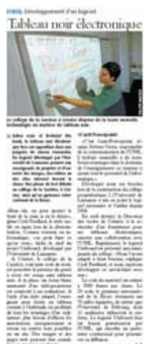
Tableau noir électronique

Adieu craie et frottoirs ! Dès lundi, le tableau noir électronique fera son apparition dans une poignée de classes romandes. Un logiciel développé par l'Université de Lausanne permet aux enseignants de projeter et d'annoter des images, des vidéos ou des sites Internet devant la classe. Une phase de test débute au collège de la Carrière, à Crissier, ainsi qu'au gymnase intercantonal de la Broye.